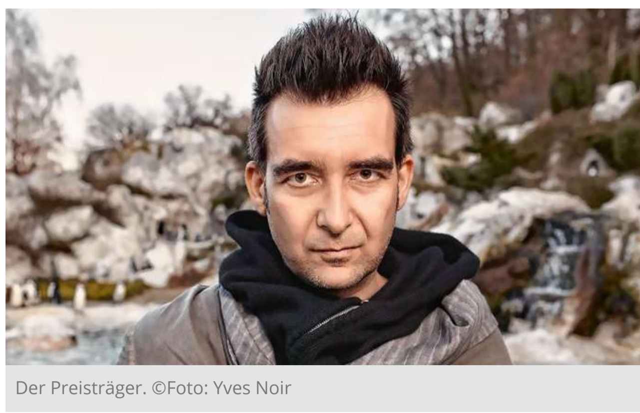
Der Preisträger.

Ein Österreicher wird am 3. Juli mit dem Leselenz-Preis der Thumm-Stiftung für Junge Literatur ausgezeichnet. Die Übergabe erfolgt im Rahmen der Eröffnung des Hausacher Leselenzes.